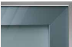
pískované lesklé sklo PORTE typ A