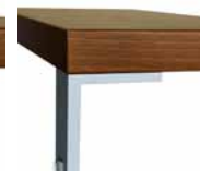
noha PORTE typ E výška 10 cm