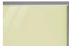
podbarvené lesklé sklo PORTE typ D