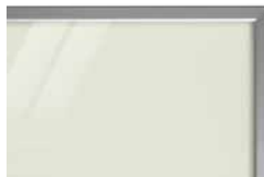
podbarvené lesklé sklo PORTE typ C