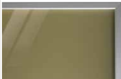
podbarvené lesklé sklo PORTE typ E