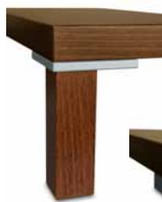
noha PORTE typ A výška 16 cm