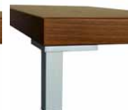
noha PORTE typ D výška 10 cm