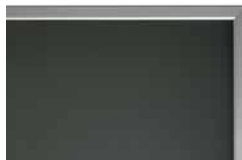
podbarvené matné sklo PORTE typ R