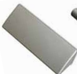
úchytka PORTE typ A délka 10,5 cm