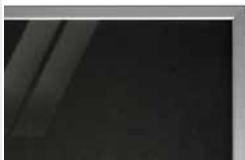
podbarvené lesklé sklo - metalíza PORTE typ N