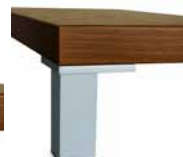
noha PORTE typ C výška 10 cm