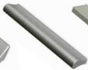
úchytka PORTE typ B délka 11,8 cm