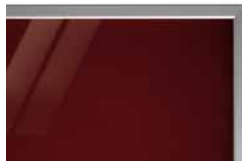
podbarvené lesklé sklo PORTE typ G