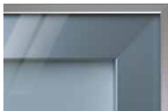
čiré lesklé sklo PORTE typ B