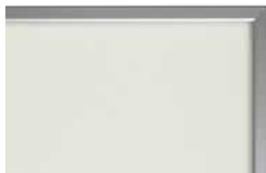
podbarvené matné sklo PORTE typ P